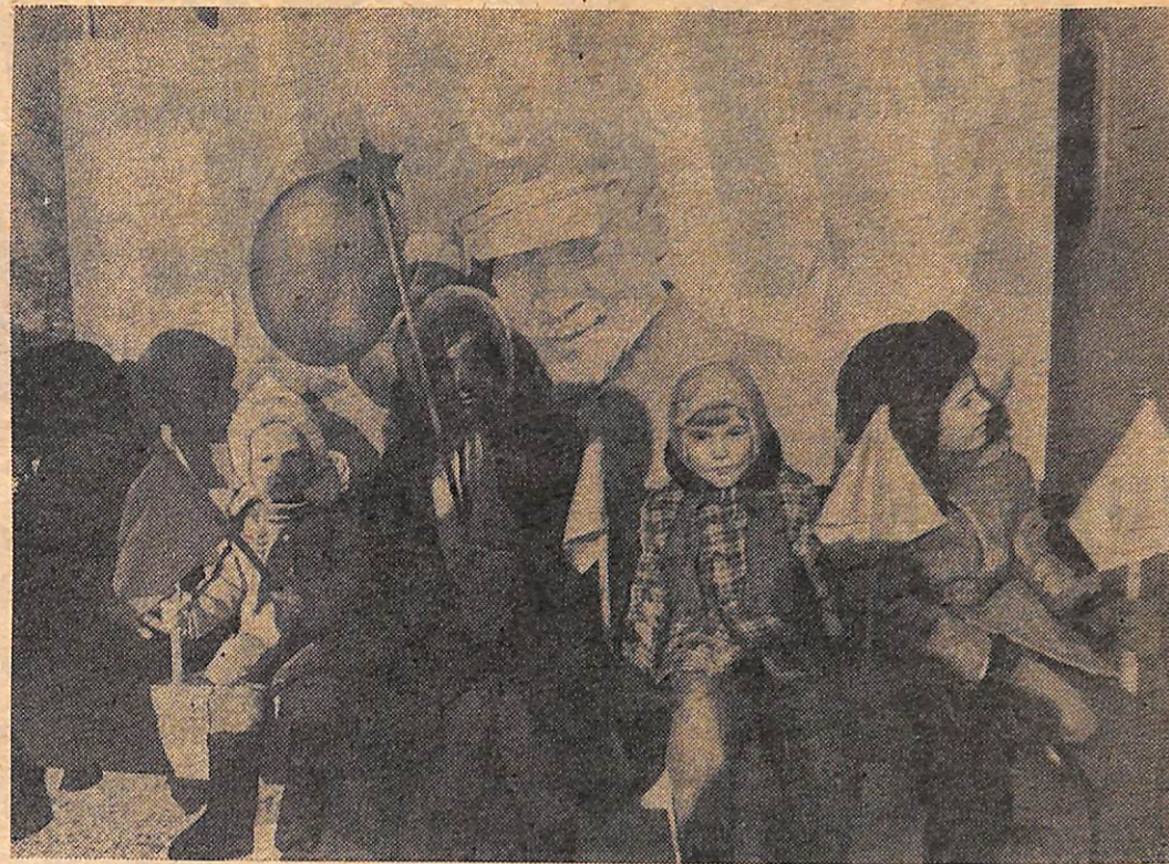
Торжественным, праздничным настроением пронизано 22 апреля, день рождения В. И. Ленина. В эти дни всюду проходят торжественные собрания, посвященные этой дате. Своими большими трудовыми делами советские люди подтверждают верность ленинскому пути.